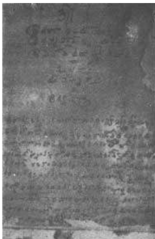
సీతారామరాజు స్వహస్తముతో వ్రాసికొనిన ఆశ్వశాస్త్రములో ఒక పుట