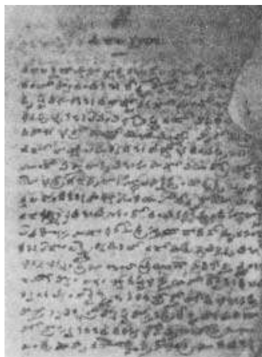
సీతారామరాజు స్వహస్తముతో వ్రాసికొనిన 'గజలక్ష్మణాని'లో ఒక పుట