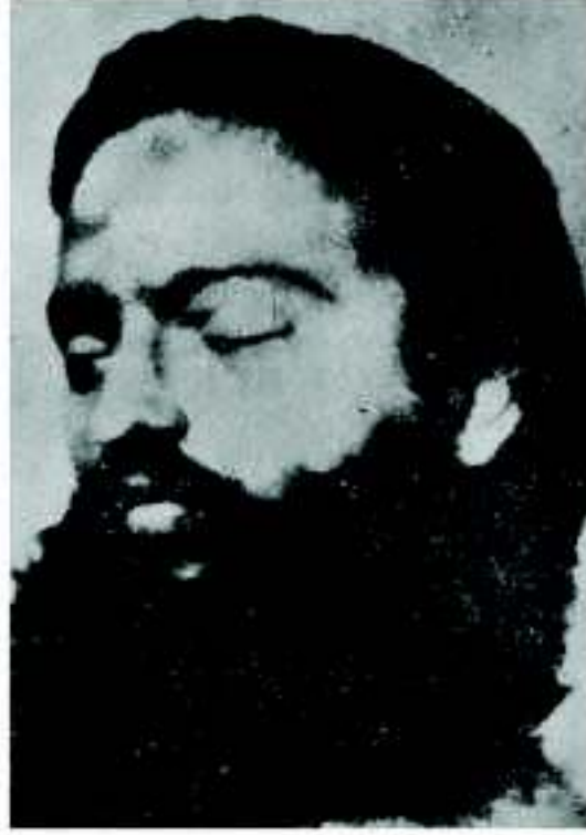
కాల్చి చంపిన పిదప ప్రభుత్వము ప్రకటించిన సీతారామరాజు ఫోటో